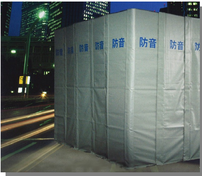
多孔質発泡ポリプロピレン