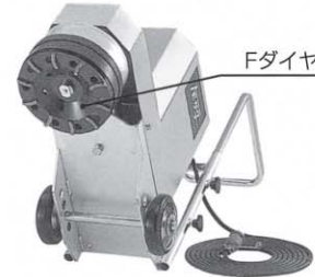
Fダイヤモンド200取付