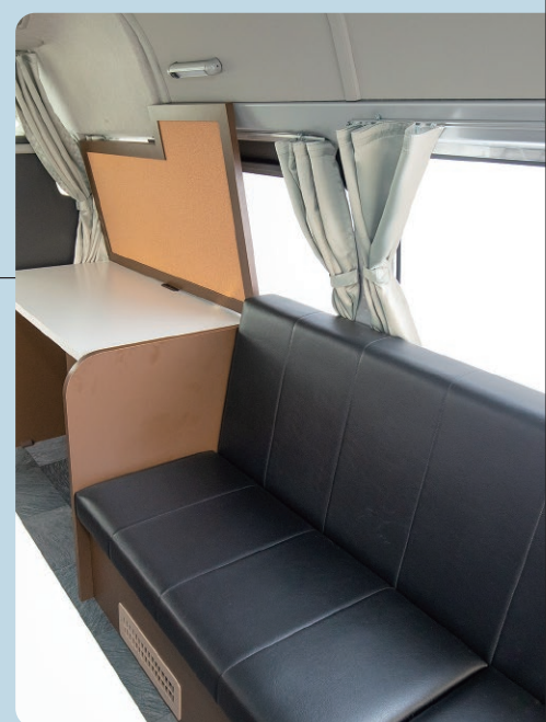
コルクボードとソファ