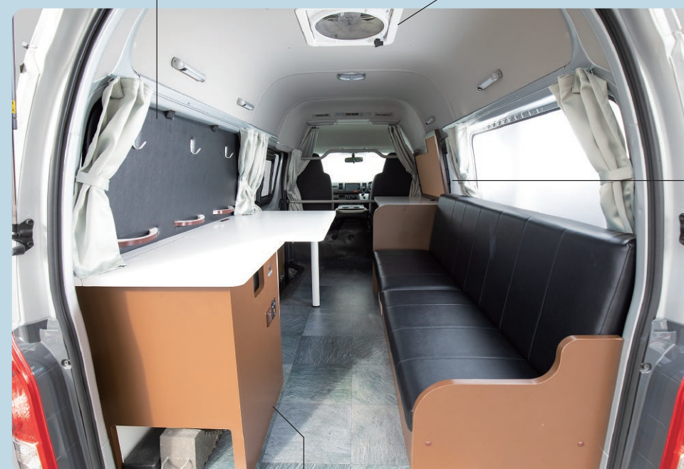
バックドア側から見た車内