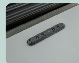
卓上 100V コンセント