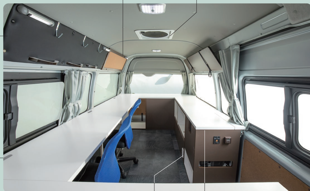
ヘルメットボード