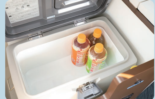
デスクの下に温冷蔵庫 (14L) を搭載