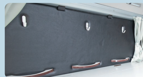
ヘルメットボード