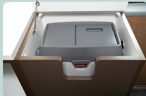
デスクの下に温冷蔵庫 (14L) を搭載